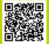
Viele weitere Ziele rund um Dorsten können Sie hier entdecken.