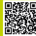
WhatsApp Mamá Castro