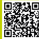
Facebook Mamá Castro

Das sind natürlich nur einige meiner persönlichen Lieblingsziele. In Dorsten und Umgebung gibt es noch viele weitere Orte, die einen Ferientag zu etwas besonderem machen können. Wenn ihr noch mehr Tipps für Familien in Dorsten und Umgebung sucht oder weitere Vorschläge für die Sommerferien habt könnt ihr gerne Teil der „Familien in Dorsten Community“ werden. Dort tauschen sich inzwischen zahlreiche Familien über Veranstaltungen, Ausflugsziele, Freizeitangebote und das Familienleben in unserer Stadt aus. Über den QR-Code gelangt ihr direkt zur Community.